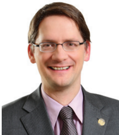
SYLVAIN GAUDREAULT Ministre des Affaires municipales, des Régions et de l'Occupation du territoire, ministre des Transports et député de Jonquière